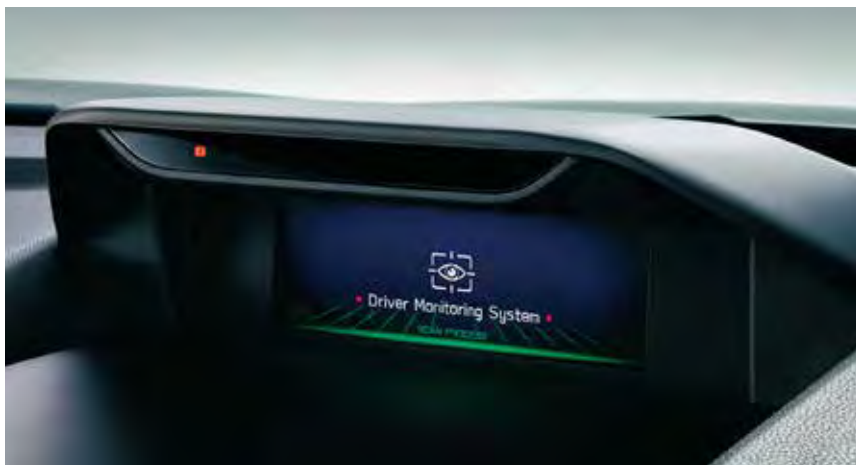
Driver Monitoring System*

Este sistema se asegura de que la atención del conductor se mantenga en la carretera, avisándole en caso de distracción. Mediante un LED infrarrojo y una cámara, el sistema monitorea al conductor en busca de signos de falta de atención o somnolencia, para advertirle que vuelva a centrar su atención en el camino.