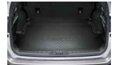
Protector de maletero