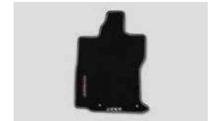
Juego de alfombras premium